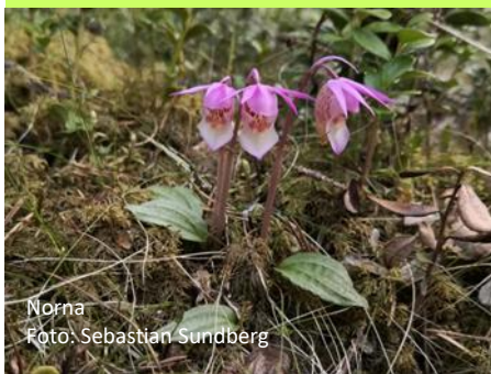
Norna