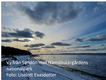
Vy från Sandön mot Nämdöskärgårdens nationalpark